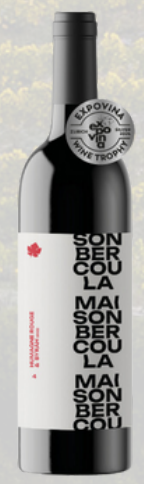
HUMAGNE ROUGE & SYRAH 4