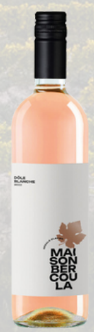
CLAVIEN DÔLE BLANCHE