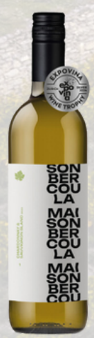
CHARDONNAY & SAUVIGNON BLANC 1