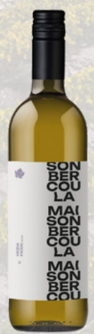
HEIDA PAIEN 5