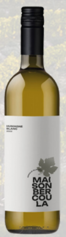
CLAVIEN HUMAGNE BLANC